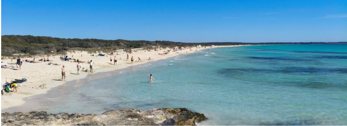
Abbildung 1: Es Trenc – Sa Rapita – Mallorca, 6. April 2026